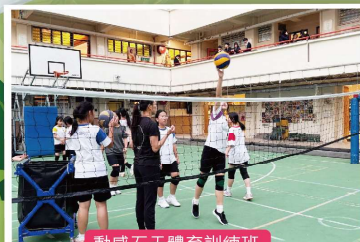
動感石天體育訓練班

與香港青年協會領袖學院合作，同學前往前粉嶺裁判法院參與二日一夜體驗營，通過法院歷奇及模擬青年國際會議等活動，從中認識及培養領袖特質。