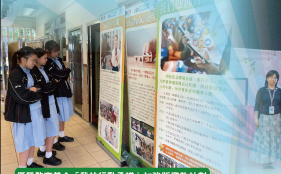
優質教育基金「我的行動承諾」加強版撥款計劃

有系統地規劃活動，加強對學生、家長和教職員的國民教育和國家安全教育及資訊素養教育。