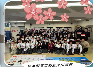
學生與東京都立深川高等學校作文化交流