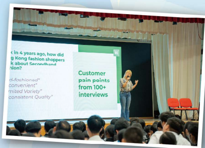
廢物不廢—探索天主創造的美善講座

同學們齊聚一堂，誦唸玫瑰經，讓大家心靈相通，靜心祈禱，感受聖母的慈愛與庇佑，最後同學們獻玫瑰花給聖母，同時將自己的心願寄託於玫瑰花中，體會奉獻的真正意義。