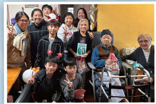
聖誕報佳音及獨居長者探訪

於2024年11月17日於荃灣沙咀道球場舉行，有超過百名同學參與，同學們都展現了出色的團隊合作精神，並積極與市民互動，分享明愛的使命與願景。