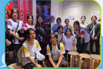
學生參觀大坑舞火龍館