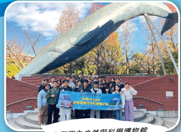
參觀國立自然與科學博物館