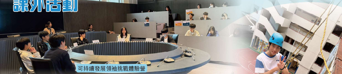
可持續發展領袖挑戰體驗營

與香港青年協會領袖學院合作，同學前往前粉嶺裁判法院參與二日一夜體驗營，通過法院歷奇及模擬青年國際會議等活動，從中認識及培養領袖特質。