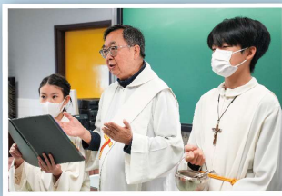
音樂室和208視藝室的祝聖禮及聖誕祈禱會

於2024年11月8日舉行倫理科週會，邀請教區全人教育委員會到校，引導學生反省平日的消費模式，了解製衣行業對環境和社會的影響，明白如何善用廢物的再用價值，愛護地球環境家園。