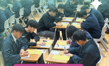
Engaging in lively discussions to elevate our speaking skills