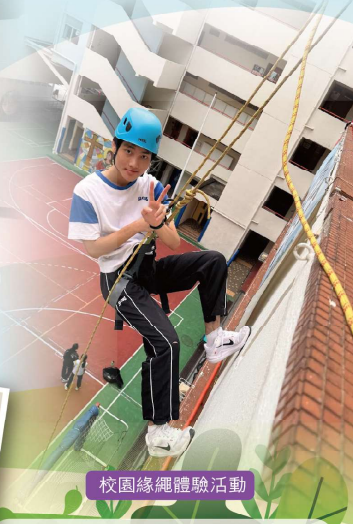
校園緣繩體驗活動

與香港遊樂場協會合作，參與對象為學校領袖團隊同學，鼓勵他們於活動中挑戰自我，提升自信，學習積極樂觀及克服困難等的正向價值。