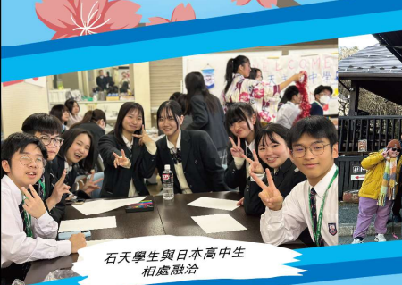
石天學生與日本高中生 相處融洽

旅程中，學生與當地學校進行交流，體驗日本教育模式，並參與舞蹈及書法活動，感受日本傳統文化。本次旅程不僅增長見識，更啟發了學生對科技與環保的思考，是一次難忘的學習體驗。