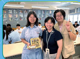
人文週 中史科 華容道比賽得獎

中五級同學於10月2日下午前往大坑進行半天的本地考察，學生先後分批參觀了大坑舞火龍館，學習本土舞火龍的文化和香港文物保育的現況；午膳進食融合菜，體驗香港多元文化特質；接住參觀大坑蓮花宮及天后廟，了解中國傳統的廟宇文化；最後前往中央圖書館參觀金庸小說的展覽，了解香港本土文學。