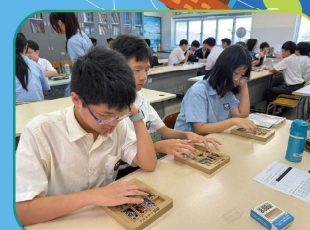
人文週 中史科 華容道比賽過程