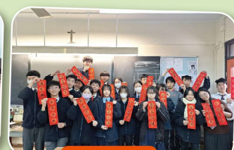
學生展示揮春作品