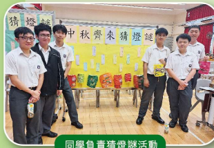
同學負責猜燈謎活動

中六學生負責攤位活動，可提高學生對中國文化的認知與興趣。學生積極參與，氣氛熱鬧。