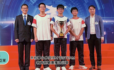
本校學生參與英才STEM教育挑戰賽獲得冠軍

香港航天創新人才培育計劃「益」STEM教育挑戰賽 香港新一代文化協會五十週年會慶系列活動 2024