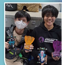
本校學生參與STEAM@屯天中小學 B-MAX GPHK 學校邀請賽獲得冠軍及亞軍