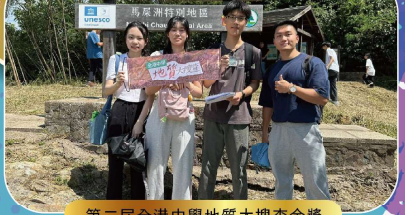
第二屆全港中學地質大搜查金獎