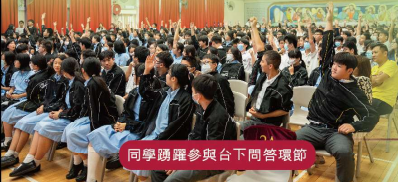
同學踴躍參與台下問答環節

四社分隊制形式進行，問題包括語文知識、中國歷史、普通話、文學、英文、宗教及人文學科，全方位考核學生的學科知識。參加者認真作答，落力為社爭取佳績，台下問答環節氣氛熱烈。