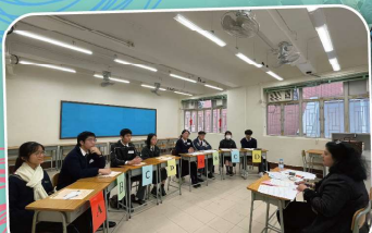
Improving with peers from other schools