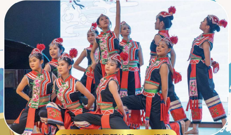
元朗區校際舞蹈比賽2024銀獎