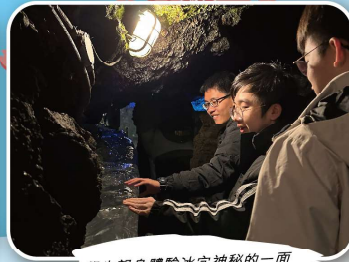
學生親身體驗冰穴神秘的一面