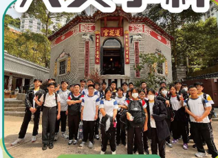
學生參觀大坑蓮花宮