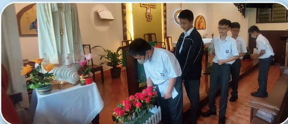
午膳誦念玫瑰經及獻花

聖母像在公教生的護送下在校園內巡遊，同學們誦唸玫瑰經及高聲唱起聖詠，聲音響徹四週，充滿了祝福與喜悅，讓每位師生都受到聖母的臨在。