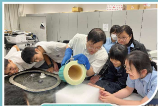
參觀香港大學實驗室