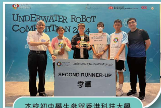
本校初中學生參與香港科技大學水底機械人比賽獲得季軍

本校會舉辦多元化的學習活動，例如跨學科 STEAM 活動、AI無人機編程班、水底機械人班、天文觀測、LEGO編程班、工程師和科學家分享。同時，老師亦鼓勵同學積極參加全港性比賽，學生投入認真，比賽成績一向卓越。本校亦設有 STEM 教室，內有雷射切割機、3D 打印機、手提電腦及 STEAM 主題的桌上遊戲，讓同學自習和進行 STEM 學習活動。