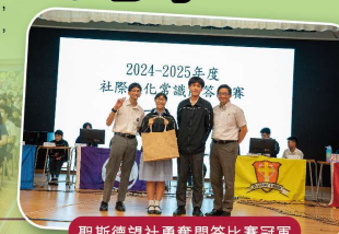
聖斯德望社勇奪問答比賽冠軍