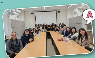
Teachers unite to guide students toward success