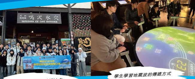
學生學習地震波的傳遞方式