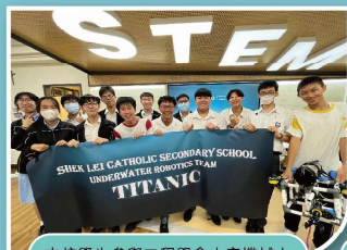
本校學生參與工程學會水底機械人比賽獲得 Fly Fish Award