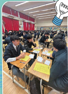
Being engaged in focused discussion

Following this, we organized a special session that united around 70 students from another secondary school, further honing their oral communication abilities. Throughout these interactive sessions, students eagerly embraced the opportunity to practice and learn from one another, generating enthusiastic feedback from all participants. We are optimistic that these enriching experiences will yield fruitful results in the upcoming public exams, empowering our students with the confidence and skills they need to shine.