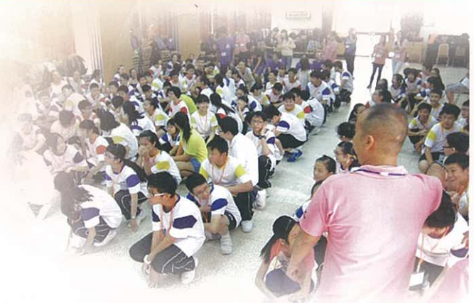
兩日一夜中一迎新學習營正式開始

營地大挑戰、認識校園多一點、班際合作挑戰活動等，學生積極參與，反應熱烈，同學均樂而忘返，為中學生活揭開了精采的一頁。