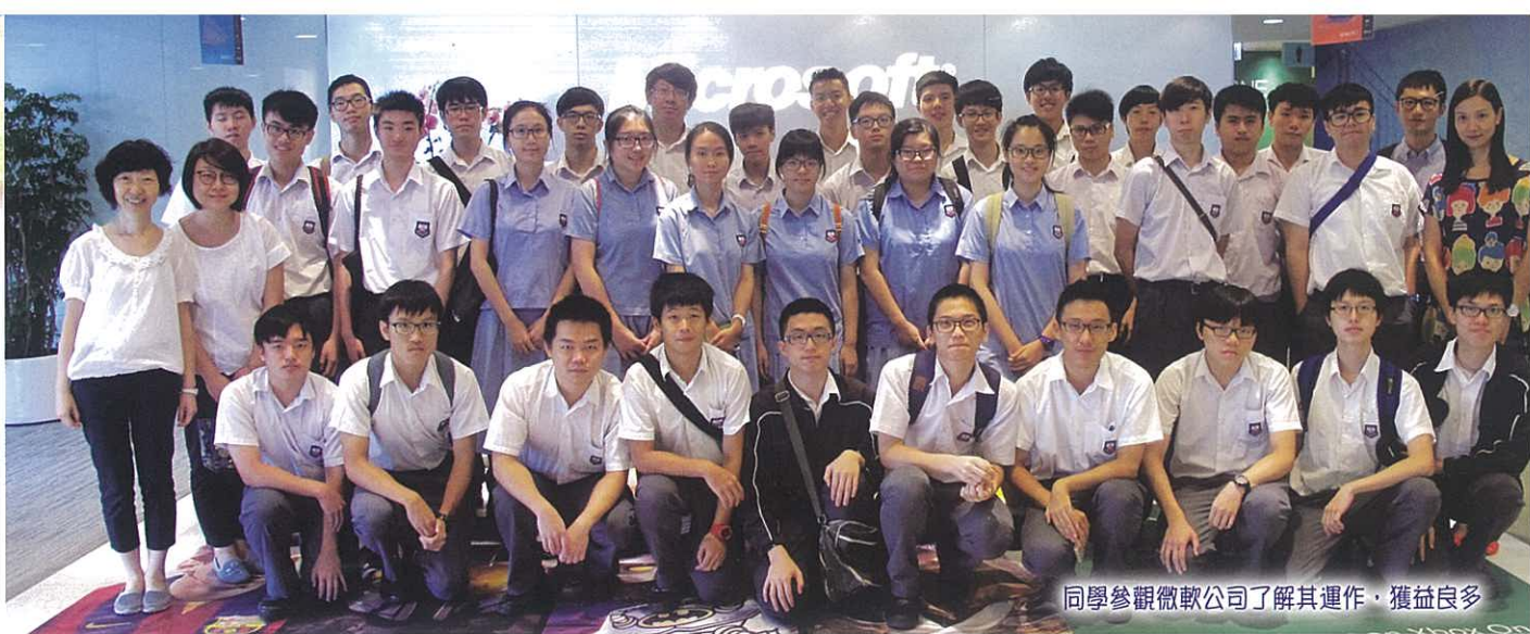
同學參觀微軟公司了解其運作，獲益良多