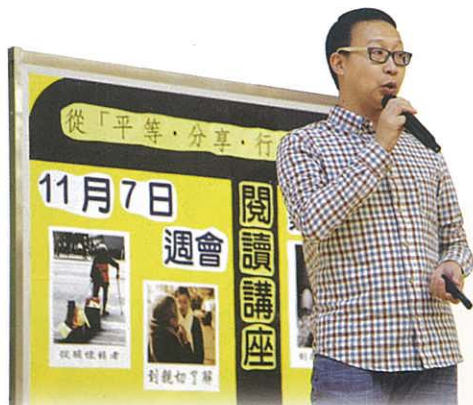
平等分享行動 作者Benson分享