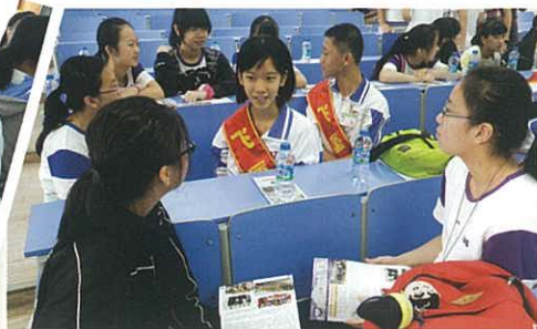
與當地中學生作交流