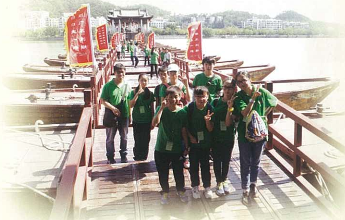
橫過中國四大古橋之「廣濟橋」