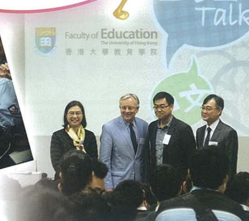
香港大學教育學院教授大合照