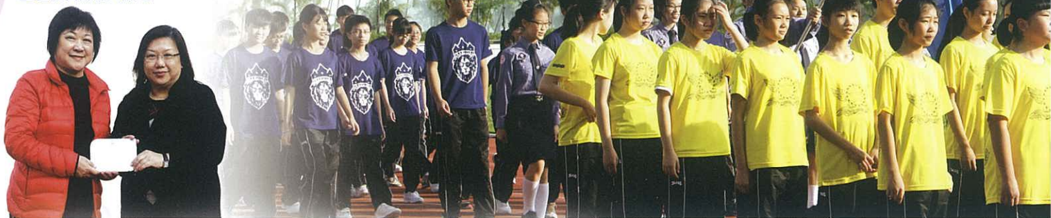
各社健兒在運動場上參與開幕禮