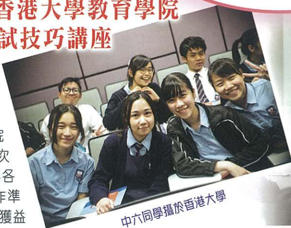
中六同學攝於香港大學

在二零一五年十二月三日，本校5位中文科老師帶領共40位中六學生參加「中文科DSE應試技巧講座」。主講嘉賓為香港大學教育學院講師盧萬方先生及林偉業先生。是次講座分析香港中學文憑試中國語文科各卷的答題技巧，為同學應付公開試作準備。參與同學皆表示是次講座令他們獲益良多。