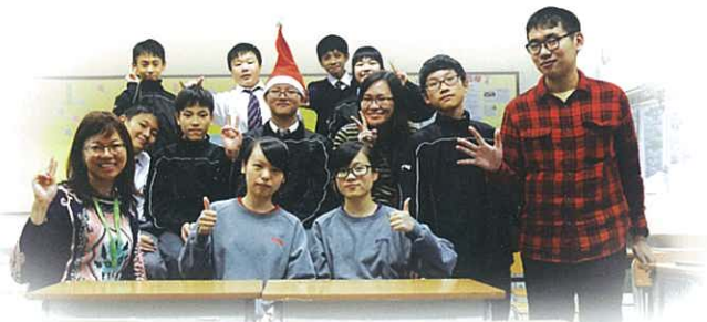
聖誕聯歡會大合照

在過去的一個學期，同學們已在小組中經歷多次不同的體驗，包括：桌上遊戲大挑戰、小組競技、考試前溫習及聖誕聯歡會等等。