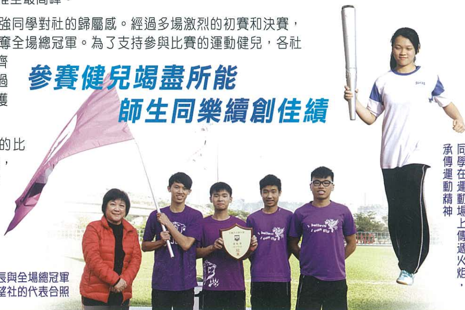
同學在運動場上傳遞火炬， 承傳運動精神