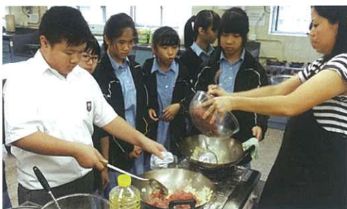
同學合作製作不同食品，以烹飪提升自信

為了培育學生的個人成長發展，「伴我Goal飛 - 青少年培育計劃」本年度共舉行六個小組活動，當中的小組包括魔術小組、烹飪小組、個人形象小組、唱歌小組、樂器小組及表達藝術小組等。低年級同學透過烹飪小組，學會製作不同類型的食品，充滿成功感之餘更感受到與人合作、與人分享食物的喜悅。此外，同學透過歌唱訓練以及在人前表演，提升自信心，亦學會以歌聲抒發內心感受，放鬆身心。而魔術小組及個人形象小組將在駐校社工的帶領下，參與校內、外不同類型的表演，掌握所學。樂器小組更積極籌備為校內低年級同學舉辦的午間活動，使同學有更多機會接觸音樂、欣賞音樂演出。同學透過參加各類活動，不但能提升社交能力和自信心，也讓他們得到全面的身心發展。