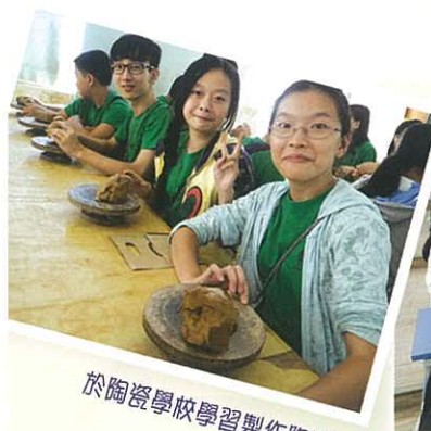
於陶瓷學校學習製作陶瓷