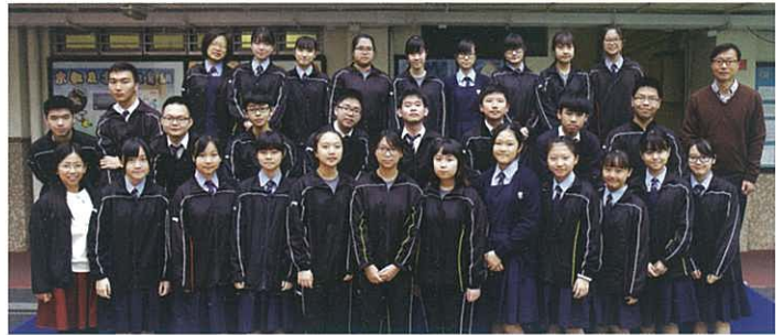
中四朋輩輔導員大合照

2015-2016年度的朋輩輔導計劃已經開展了！中四學長已經宣誓成為朋輩輔導員，並開展了一連串的活動，包括策劃了兩次同樂日。過程中，中四朋輩輔導員學習了策劃活動的技能，也學會了如何關心中一的學員。中一、中四的同學亦可透過同樂日的活動建立了友誼，彼此相處融洽。