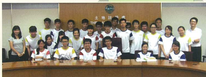
參觀土地註冊署後大合照