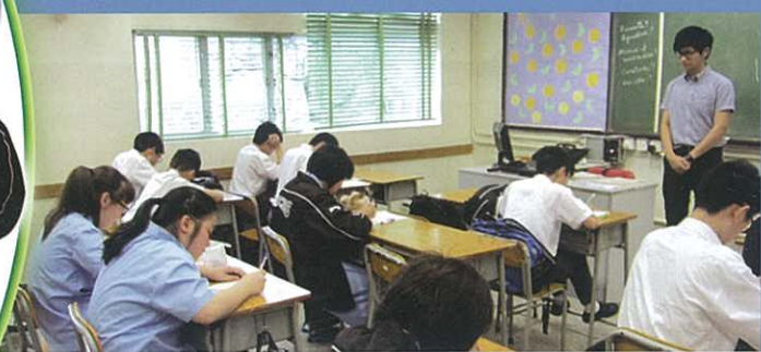
語文知識課後學習班