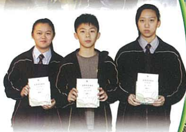
網上閱讀初中組得獎同學

為了鼓勵同學善用課餘時間學習中文，本校中文科參加了「智愛中文平台」閱讀計劃，幫助同學建立良好的閱讀習慣，要求學生閱讀不同體裁、主題的優秀文章，並依時完成相關練習。