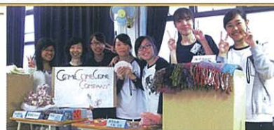
本校隊伍「Come Come Come」最終獲得「最高銷售獎」亞軍