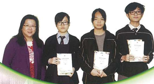
網上閱讀高中組 得獎同學