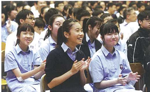
同學在四社問答比賽中反應熱烈

由中國語文科、中國文學科、普通話科及中國歷史科合辦的四社問答比賽，已於5月13日周會時段順利舉行。同學積極參與四社問答比賽，台上同學積極搶答，台下同學反應熱烈，踴躍參與遊戲，把場內的熱烈氣氛推至高潮，亦反映出同學對中國語文、文學、普通話和中國歷史的認識及喜愛。四社問答比賽最後由聖達明社勝出。