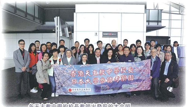
各天主教中學的校長教師出發前的大合照