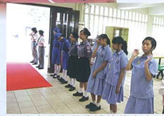
紅十字會在畢業禮接待來賓