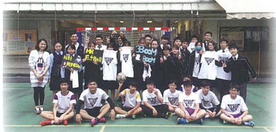
比賽後來張大合照

而新一屆學生會內閣選舉也開始籌備，希望同學們踴躍參加，繼續為同學服務。最後，我在此祝願來年的內閣可以一帆風順，長江後浪推前浪，一代新人勝舊人。