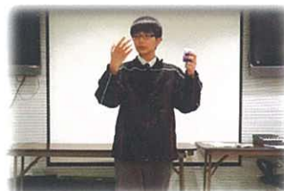
F.1 Story-telling Competition