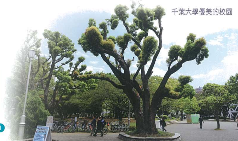
千葉大學優美的校園