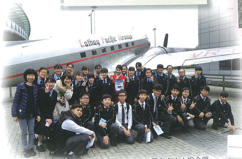
與國泰空中小姐合照

我明白到關鍵是要知道自己的興趣與工作性質，而不應純粹貪圖優厚的薪金和福利，因為只有這樣，才能體會到工作的樂趣。