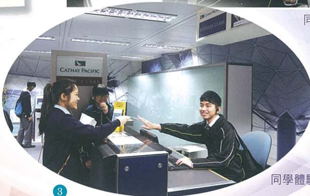
同學體驗航空櫃位工作