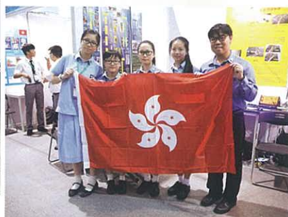
第十四屆廣東省少年兒童發明獎 - 香港代表