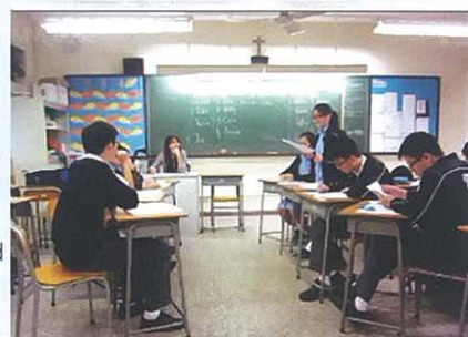
F.4 Social Issues and Debate Course

They found the courses were useful for consolidating their learning in formal lessons and providing extra knowledge to brush up their English skills.