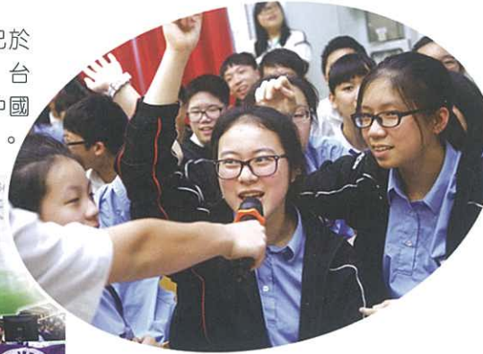
台下同學積極回答問題