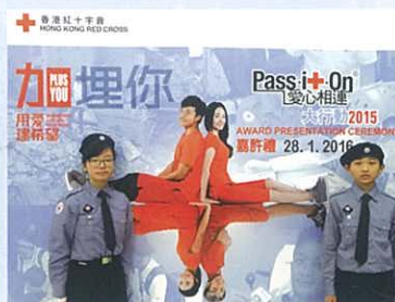
本校紅十字會獲長期支持大賞