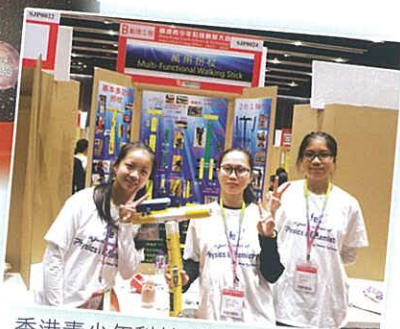
香港青少年科技創新大賽 15-16 比賽情況