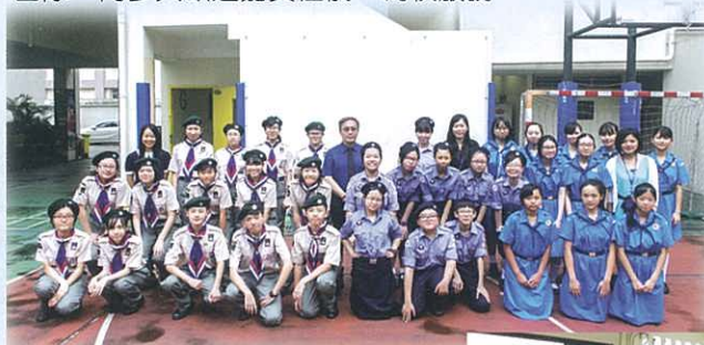
本校制服團隊大合照

紅十字會員早前參加了「愛心相連大行動2015」慈善義賣之嘉許禮，並獲頒長期支持大獎。另於畢業禮當日，與其他制服團隊一同參與歡迎嘉賓禮儀，為校服務。