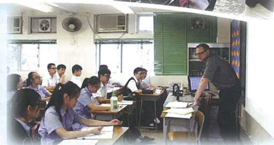
F.4 English Elite Class