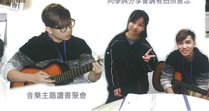
音樂主題讀書聚會