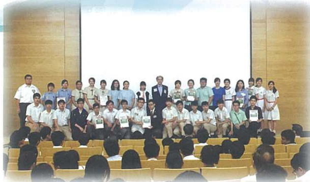
「全港中學生齊出招『保障個人資料·見招拆招』廣告短片大賽」獲得優異獎