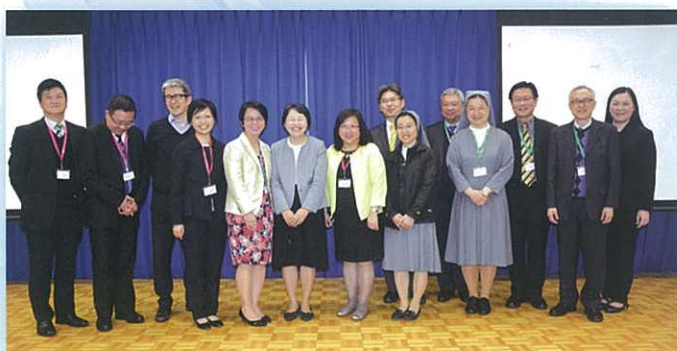
校長與上智大學副校長合照