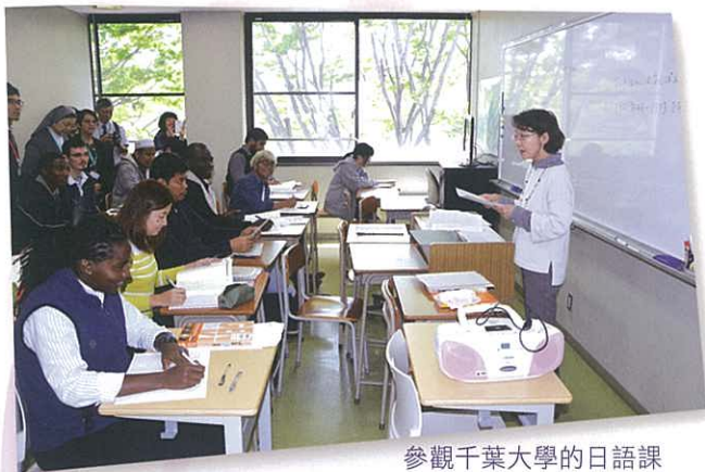
參觀千葉大學的日語課

受校園生活。校長及老師更參觀東京不同大學的課堂，校長、老師親身體驗在日本大學上課的情景，其中千葉大學的日語課，令人樂在其中。校長、老師更與日本文省部及日本八十多間大學的代表交流，機會實屬難得，校長、老師在交流過後對日本大學收生的情形有更深入的了解。大會更邀請來自香港的日本留學生分享留學日本的生活，他們細訴留學日本的趣事、於日本遇上的難題及解決方法等。通過以上參觀及分享，校長及老師進一步瞭解赴日升學渠道、申請方式、入學要求、學費等資訊，希望為香港學生探索更多海外升學的出路，助他們達成夢想。