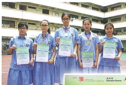
香港學生科學比賽