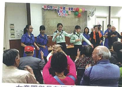
女童軍與長者打成一片