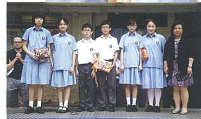
Prize winners of Q&A Battle