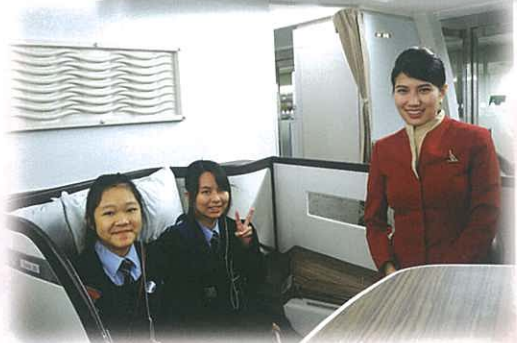
同學學習待客之道