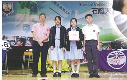
在四社問答比賽中獲獎的隊伍