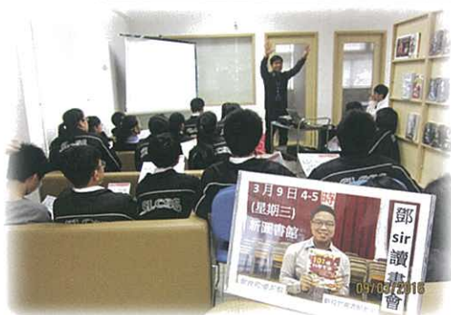
同學與分享會講者拍照留念

新圖書館重開後，「愛·讀書會」茶聚可在更舒適的環境舉行。伍健明老師鄭重推薦劉慈欣獲獎科幻小說《三體》等著作，引領同學走進太空科學的領域；鄧焯威老師閱讀龐雜，除衛斯理、兒童科普讀物外，亦涉獵神秘北韓、相片編輯等書，參加者在兩位老師身上滿有得著。而閱讀大使以流行音樂文化為題的聚會，有幸邀得舊生即席演繹經典歌曲，令現場氣氛熾熱，學生亦從中認識到歌劇、音樂劇之別。