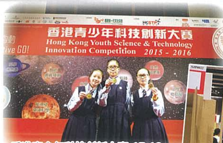
香港青少年科技創新大賽 15-16 獲得「優異獎」

本年5月，以上同學亦獲推薦代表香港到廣州大學城參加由廣東發明協會、廣東科學中心等組織所主辦的「第十四屆廣東省少年兒童發明獎」比賽，並得到「優秀組織獎」。