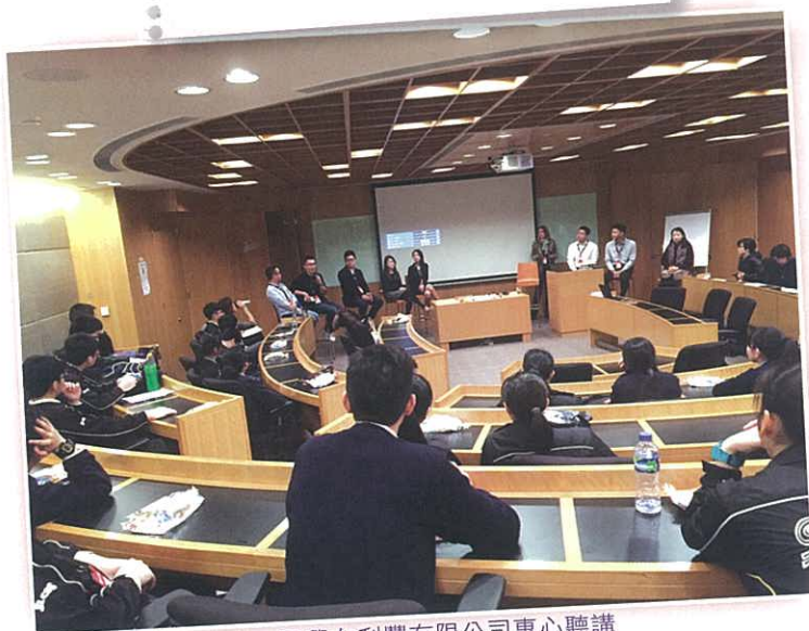
同學在利豐有限公司專心聽講

經過這次活動後，我發現不少公司看重的不是你所修讀的學科，而是你對工作表現出來的熱誠。