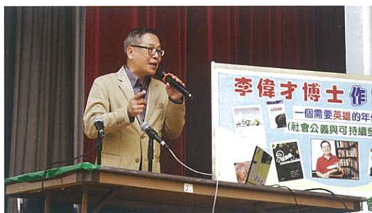
李偉才博士作家講座

學養豐富的李博士，為我們透析混亂複雜的世代，種種社會問題的因由，乃源自我們無止盡的欲望，一切以資本發展為首務，正極速把人類推向不歸之路。科技進步，貧富懸殊反而變本加厲，地球資源不日被耗盡，只有懸崖勒馬，停用化石能源，躬行儉樸生活，才可扭轉命運。李博士的理想與教宗方濟各不謀而合，他鼓勵同學只要立意改變，秉持公義之心，社會自可得享持續發展。