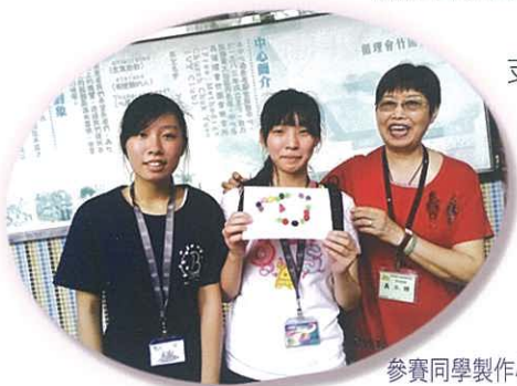
參賽同學製作心意卡，並與長者合照