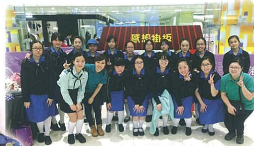
女童軍擔任小記者