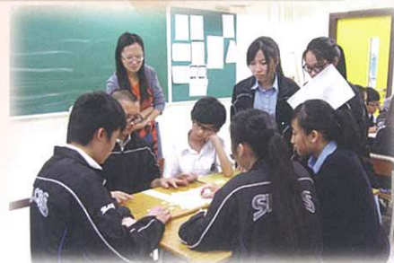
F.1-4 Inter-class Scrabble Competition