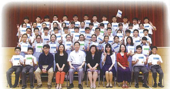
Certificate winners of 67th English Speech Festival