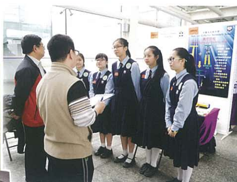
香港學生科學比賽