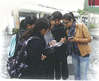
F.2 Tourist Project