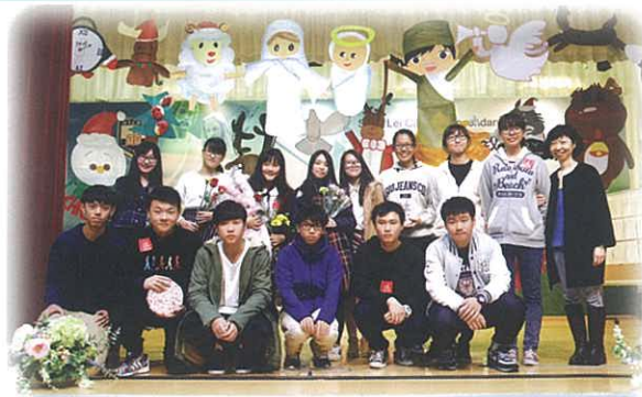
音樂比賽滿載聖誕氣氛