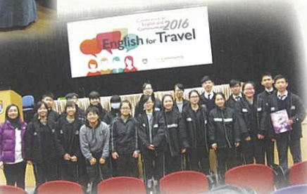
Conference on English and Communication 2016 - 'English for Travel' organized by HKU Community College