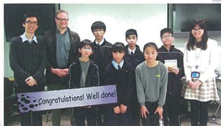
F.1 Story-telling Competition (Group photo)

This year, we held various competitions for students to take part in at school. Students enjoyed taking part in these competitions and most importantly, they have developed their interest and confidence in learning and using English in and out of the classroom.