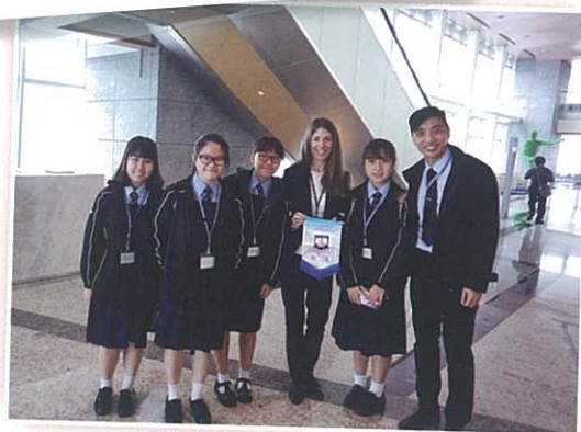
與德意志銀行的職員合照