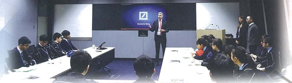
同學體驗銀行的會議情況

藉著參觀，我深刻地體會到投身幼兒教育行業，是需要多與不同類型的人士溝通，而且發揮想像力也是十分重要的。