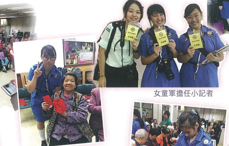
女童軍擔任小記者