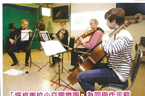
「塔皮奧拉小交響樂團」為同學作示範