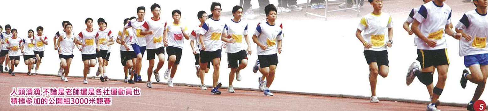
人頭湧湧，不論是老師還是各社運動員也積極參加的公開組3000米競賽