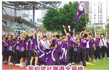
聖約望社獲得全場總冠軍，社員興奮萬分