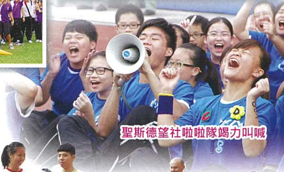
聖斯德望社啦啦隊竭力叫喊