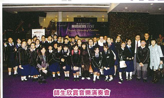
師生欣賞音樂演奏會