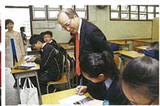
教育局局長了解智選人生計劃的活動