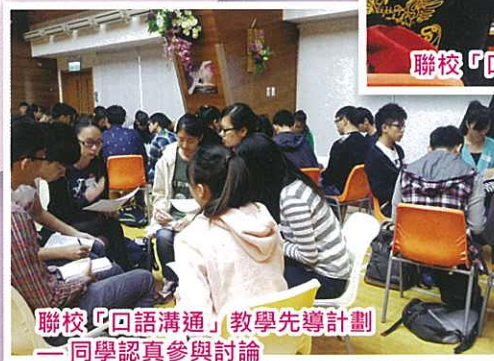
聯校「口語溝通」教學先導計劃——同學認真參與討論