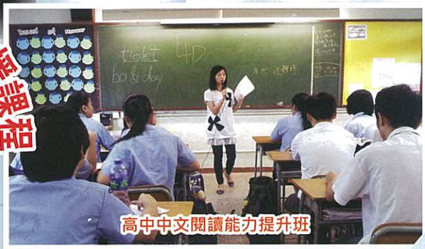
高中中文閱讀能力提升班

為了進一步提昇同學的語文能力和鞏固他們的學習基礎，分別舉辦課後拔尖班和課後學習支援課程，如深層閱讀班、文言閱讀策略班、語體文閱讀提昇班等。