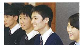
學生暢所欲言，氣氛愉快