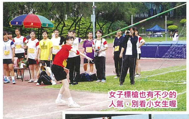
女子標槍也有不少的人氣，別看小女生喔

情況下都要勇於嘗試，挑戰自我。主禮嘉賓的金石良言，令同學們獲益良多。在同學們熱烈的掌聲之下，校旗冉冉下降，石籬天主教中學第三十二屆陸運會圓滿結束。