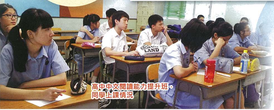
高中中文閱讀能力提升班。同學上課情況