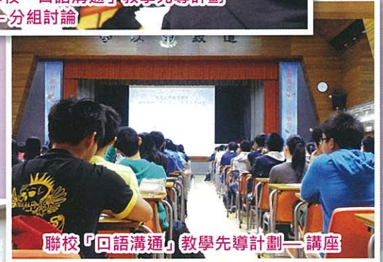
聯校「口語溝通」教學先導計劃——講座