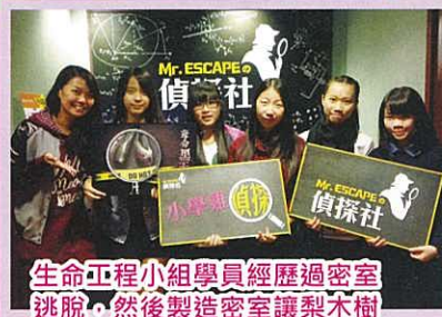
生命工程小組學員經歷過密室逃脫，然後製造密室讓梨木樹的青少年參與

為了培育學生的個人成長發展，本年度共舉行九個小組活動，當中的小組包括 BREAKING 小組，HIP HOP 小組，魔術小組，創意 DIY 廚房，暑假 JAZZ 小組，籃球小組，生命工程小組，個人形象小組等。其中更以 BREAKING 小組最為人熟悉，部份隊員經過三年多的訓練並經歷大大小小的比賽以及表演，現已能獨當一面地建立自我的舞風並能認清自己的目標努力向前。