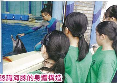
認識海豚的身體構造

本校童軍團亦於2013年9月14日到青衣參加升旗禮儀研習班，讓學生認識國旗、國歌、升旗的步驟及禮儀、認識基本法，從而認識中國。