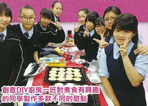
創意DIY廚房一班對煮食有興趣的同學製作多款不同的甜點