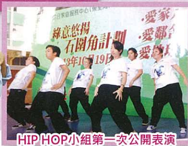
HIP HOP 小組第一次公開表演