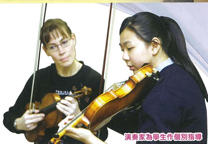
演奏家為學生作個別指導

為了進一步欣賞「塔皮奧拉小交響樂團」聯同本地知名演奏家的精湛演出，石籬天主教中學約九十多名師生於十二月三日及四日到香港大會堂音樂廳欣賞國際音樂節「戀人組曲」的音樂演奏會，以音樂穿梭歐洲大陸，豐富藝術人生。