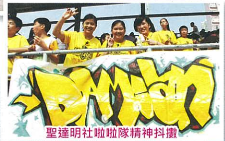
聖達明社啦啦隊精神抖擻