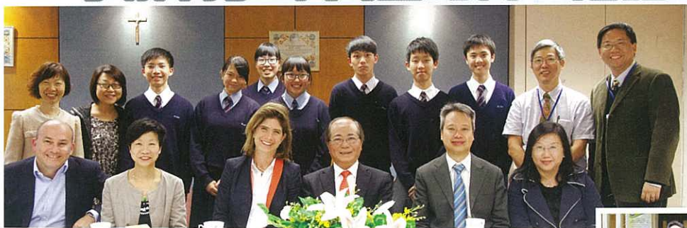
教育局局長吳克儉先生、葵青區高級學校發展主任甄寶華先生、婦女基金會代表、摩根大通代表與校長、副校長及師生合照

他在求學階段的奮鬥歷程，並勉勵學生在遇到挫折的時候，必須把這些絆腳石化為推動的力量，不要輕言放棄。局長的金石良言及豐富的人生經驗令學生獲益良多。