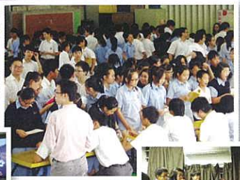
One-minute "Shall We Talk" counter