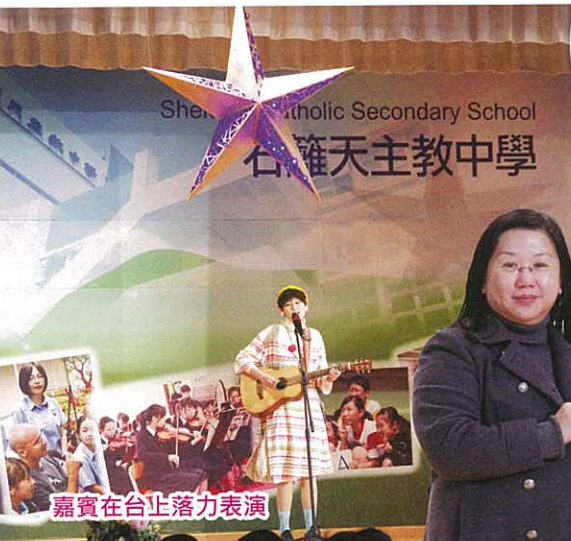
嘉賓在台上落力表演