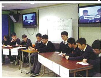
Senior forms join a debate-format forum