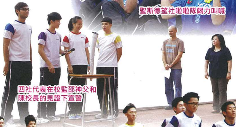
四社代表在校監邵神父和陳校長的見證下宣誓