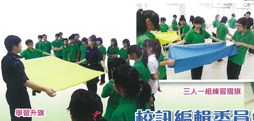
三人一組練習摺旗

本校童軍團亦於2013年9月14日到青衣參加升旗禮儀研習班，讓學生認識國旗、國歌、升旗的步驟及禮儀、認識基本法，從而認識中國。