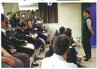
S1-2 students watching science documentaries