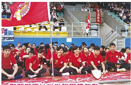
聖葛斯瑪社啦啦隊獲獎無數

陸運會以社際形式進行以團結社員，加強各同學對社的歸屬感。同學一方面能藉着參與運動項目一展所長，又能为社出一分力，爭取佳績。為了支持參與比賽的運動健兒，四社的啦啦隊隊員在一眾社幹事帶領下齊聲為比賽中的健兒打氣喝采，令現場一片熱鬧，氣氛高漲。四社的啦啦隊經過兩天的歡呼吶喊，結果由聖若望社榮獲社際啦啦隊冠軍。