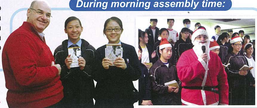
Book sharing by students