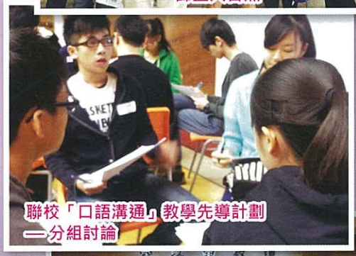
聯校「口語溝通」教學先導計劃——分組討論