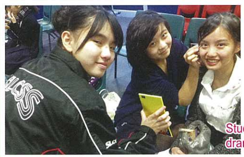
Students wore costumes and put on make-up for the dramatic duologue section of the Speech Festival.

A large number of our students participated in the 65th Annual Hong Kong Speech Festival during the last term. Although most of the entrants learnt and recited poems, we also had students give speeches and several groups performed short scenes from plays. It is good to see so many of our students achieve merit awards for their efforts.