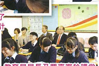
教育局局長及眾嘉賓於課堂參與智選人生計劃的活動