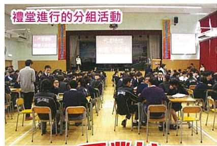
禮堂進行的分組活動