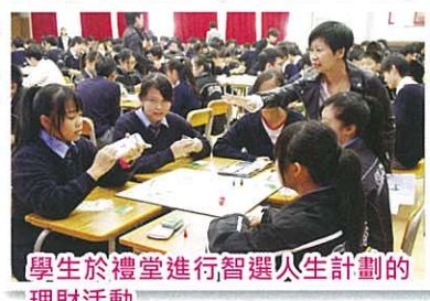
學生於禮堂進行智選人生計劃的理財活動