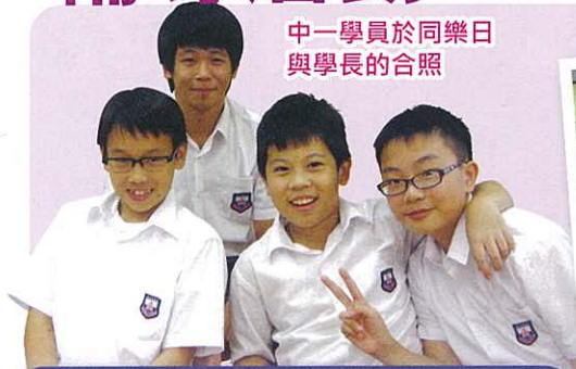
中一學員於同樂日與學長的合照