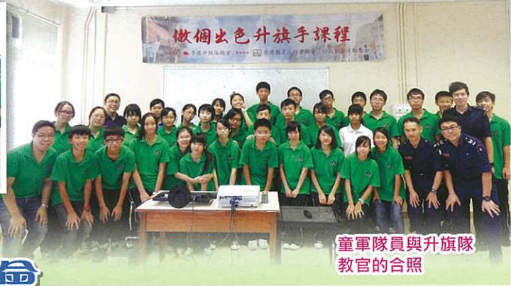
童軍隊員與升旗隊教官的合照