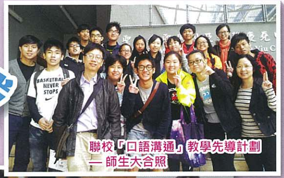
聯校「口語溝通」教學先導計劃——師生大合照

在2014年1月11日，本校全體中六學生參加聯校活動的模擬DSE 中國語文試卷四「說話能力」考試。六間參與聯校活動的中六學生皆需參加，學生考取的分數將作為校內考試中文科口試成績。