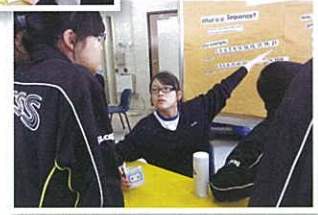
Tongue Twister game organised by the English Ambassadors

Correct pronunciation and spelling are checked at the "Word Power" counter.