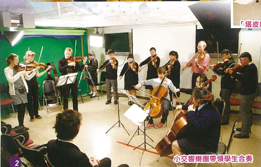
小交響樂團帶領學生合奏