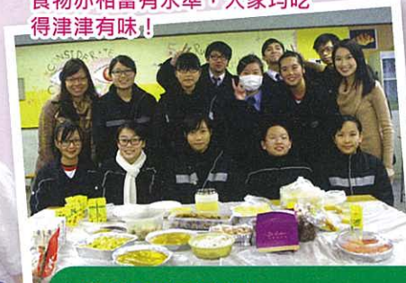
食物亦相當有水準，大家均吃得津津有味！

中四學長宣誓成為朋輩輔導員，並開展了一連串的活動，包括策劃了兩次同樂日。中一和中四的同學亦可透過同樂日的活動建立了友誼，相處亦相當融洽。