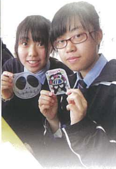
極具創意的收縮膠設計