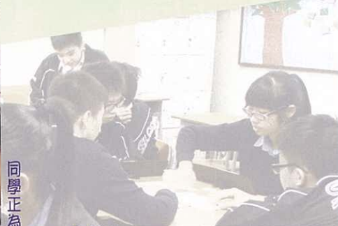
組員正為「破冰遊戲」而努力！