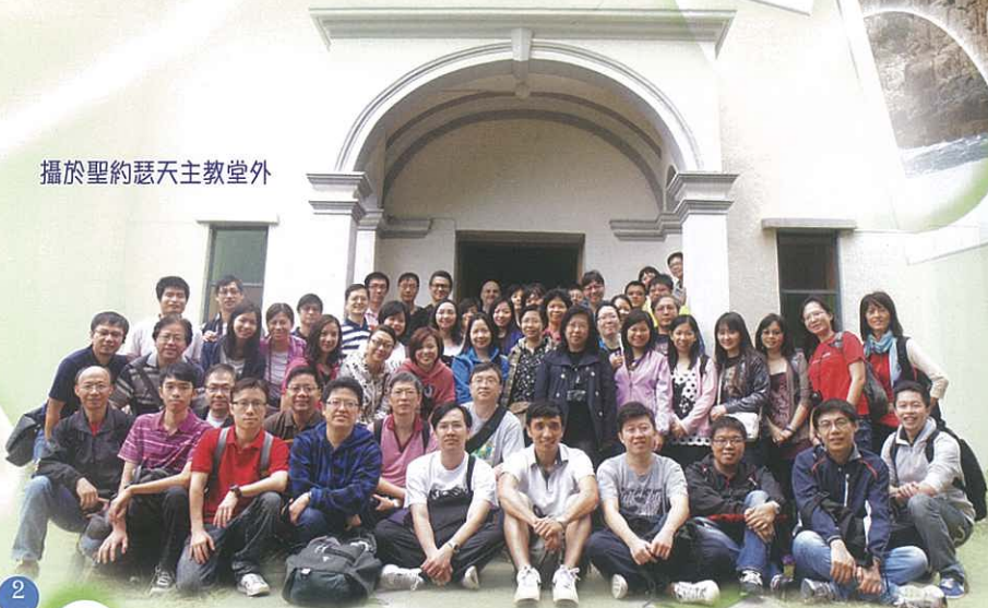
攝於聖約瑟天主教堂外