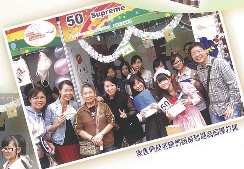
家長們及老師們親身到場為同學打氣