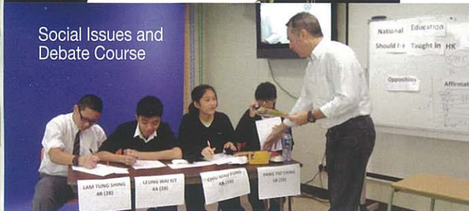
Social Issues and Debate Course