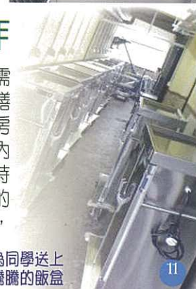
環保餐車為同學送上熱騰騰的飯盒