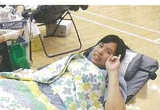
捐血救人，發揚助人精神

本校的捐血日已於2012年9月18日舉行，共有96名學生成功捐血，可見本校的學生積極支持捐血活動，充滿愛心。期望來年大家繼續踴躍支持捐血活動，發揚捐血救人的助人精神。