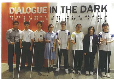
同學學習使用導盲竹

中五級修讀組合科學(生物)的同學於2012年9月5日到美孚黑暗中對話體驗館參觀。透過在黑暗環境中的探索、各類的體驗及與視障人士的討論，讓學生明白到視障人士在生活中所遇到的困難及擔憂。