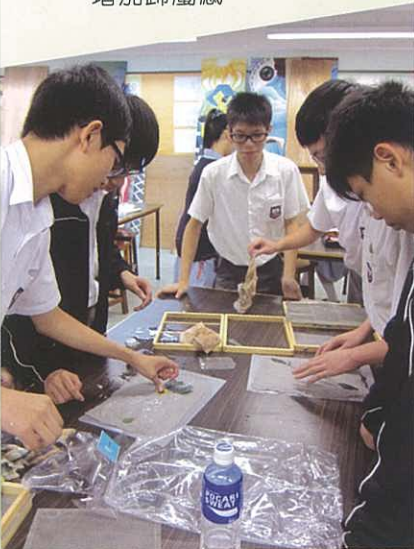
同學正為自己的再造紙作裝飾