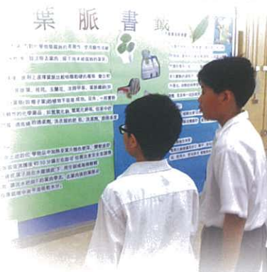
自製葉脈書籤製作

Science Buddy於上學期為同學籌辦了不同內容的午間科學活動，包括葉脈書籤製作、自製萬花筒及收縮膠設計。活動內容有趣、吸引，深受同學歡迎。下學期尚有三次午間科學活動，同學萬勿錯過。