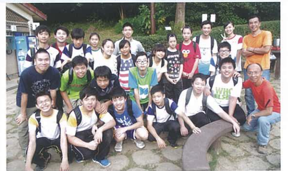
經過十公里的路程後，終於到達了目的地！