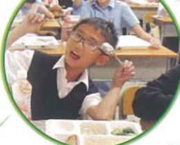
中一同學午膳情況