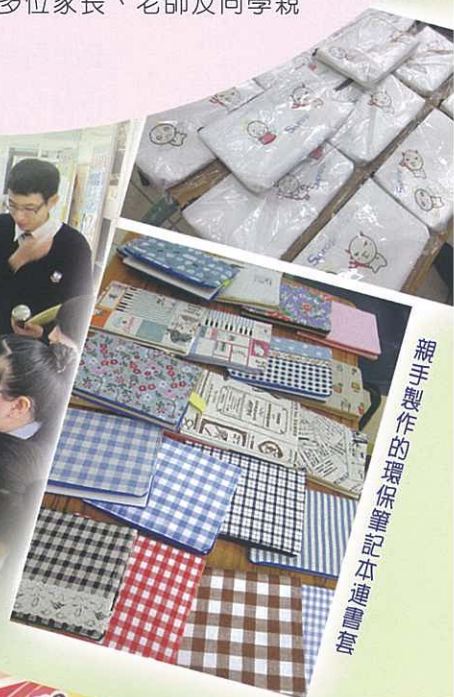
親手製作的環保筆記本連書套