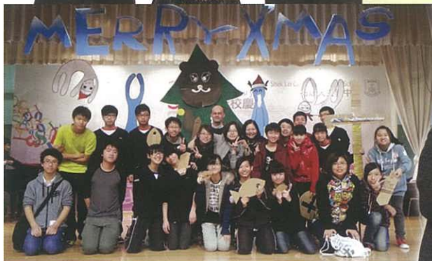
聖誕聯歡工作人員大合照