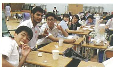
順利完成捐血，享用小食飲品