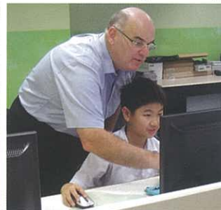
Prezi training workshop