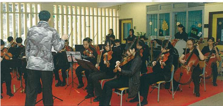
以音樂演奏歡迎嘉賓