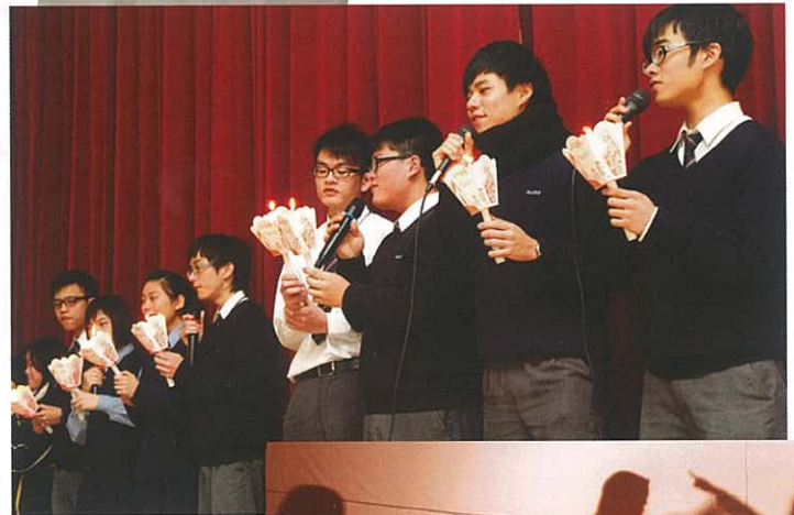
派遣禮學生上台唱歌