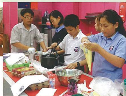
同學於甜品班用心製作泡芙