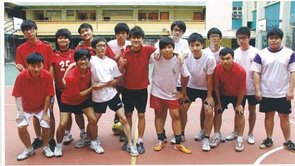
高級組班際足球比賽 6G對6E