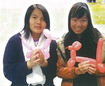
結伴同行參加者與 老師展示氣球製成品