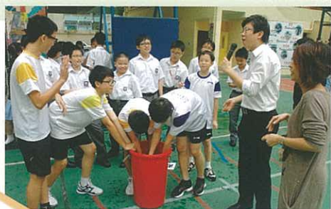
各班都積極備戰午間活動

本計劃由老師和學長帶領，定期於課後舉行聚會，為低年級學生提供功課輔導和成長活動，協助學生提升學習和社交能力，並加強同學間的朋輩支援。