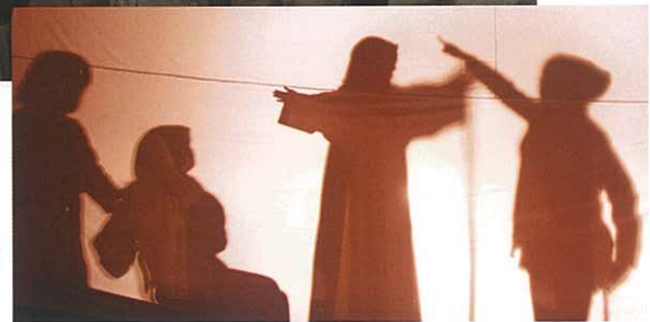
聖誕聯歡表演 (影子戲)