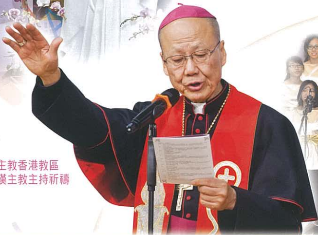
天主教香港教區 湯漢主教主持祈禱