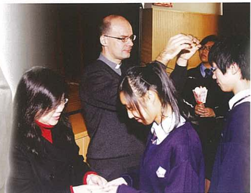
神父為學生進行「覆手」禮，校長致送紀念品予中六、中七學生