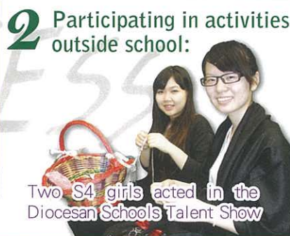
Two S4 girls acted in the Diocesan Schools Talent Show