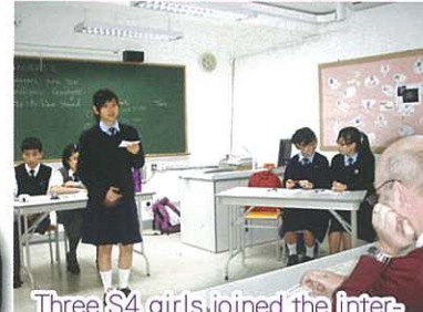
Three S4 girls joined the inter-school NESTA debate