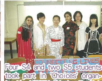
Four S4 and two S5 students took part in 'Choices' organized by NESTA (Native English Speaking Teacher Association)