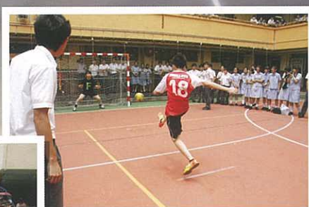
比賽進行得如火如荼。引來不少同學圍觀。2B班(穿紅衫者)對4F班(穿黑衫者)比賽。雙方勢均力敵。最終以射十二碼定勝負