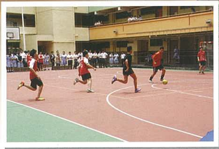
初級組班際足球比賽