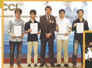
HKVEP Workplace English Contest 2012

(1) Congratulations to four S5 boys who won the third place in the HKVEP Workplace English Contest organized by the Hong Kong Vocational Training Council in May.