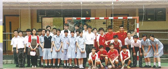
友誼第一。比賽第二 同學們的大合照