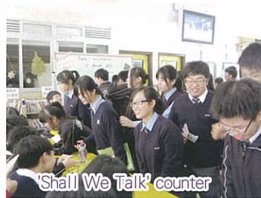
'Shall We Talk' counter