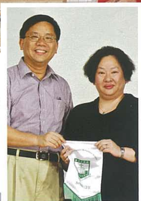
致送紀念旗給馬博士