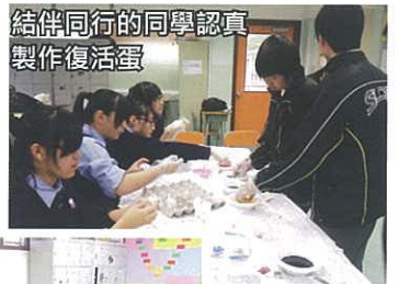
結伴同行的同學認真製作復活蛋