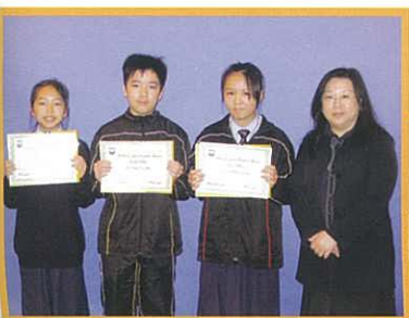
Top students in English exams or tests

(2) We recognized student hard work in examinations or uniform tests.