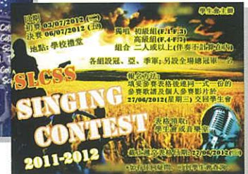
試後活動安排 - 歌唱比賽活動宣傳單張