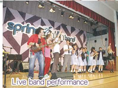
Live band performance