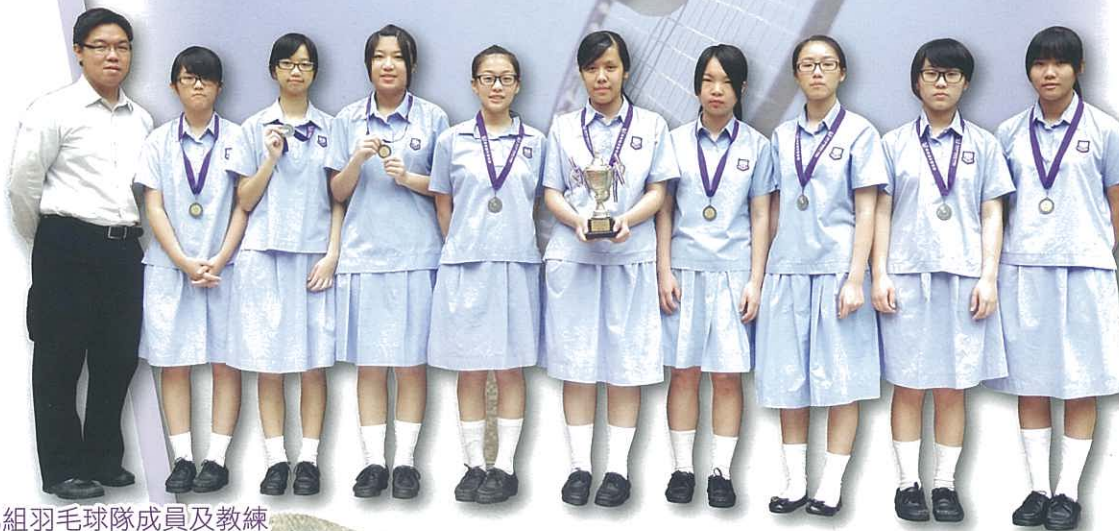
女子乙組羽毛球隊成員及教練