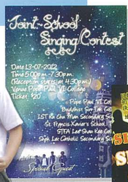
相隔多年。學生會再為同學爭取聯校活動。