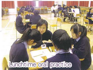
Lunchtime oral practice