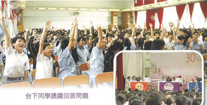
台下同學踴躍回答問題