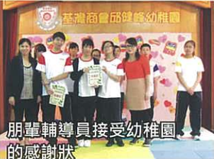
朋輩輔導員接受幼稚園的感謝狀