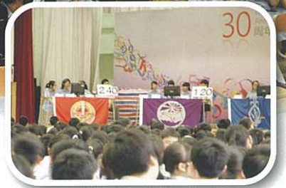
四社的參賽者積極搶答