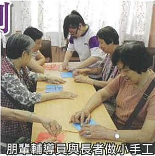
朋輩輔導員與長者做小手工