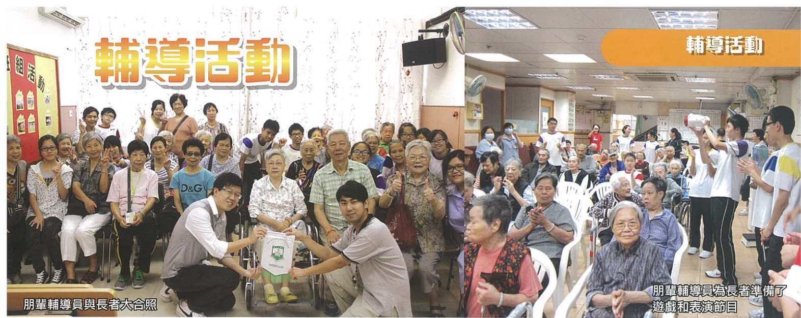
朋輩輔導員與長者大合照