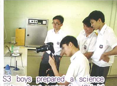
S3 boys prepared a science video about water for 'Clipit' organized by NESTA