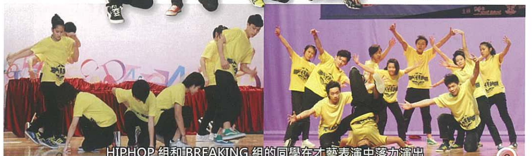
HIPHOP 組和 BREAKING 組的同學在才藝表演中落力演出