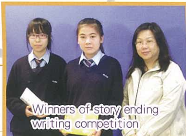
Winners of story ending writing competition

(3) Students were awarded in different internal competitions.