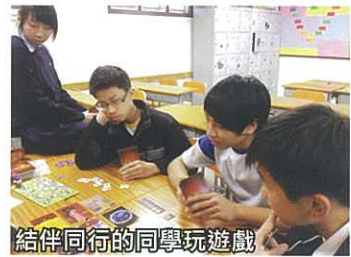
結伴同行的同學玩遊戲