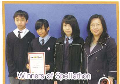
Winners of Spellathon