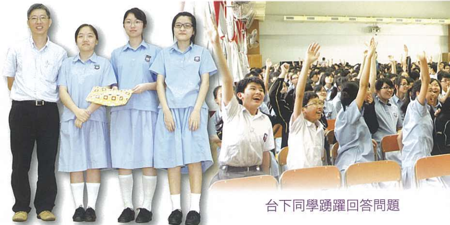
聖葛斯瑪社奪得四社問答比賽冠軍