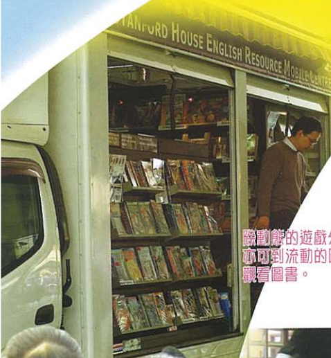
除傳統的遊戲外，同學亦可到流動的圖書車，觀看圖書。