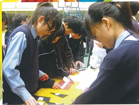
同學們正聚精會神地解決數學難題