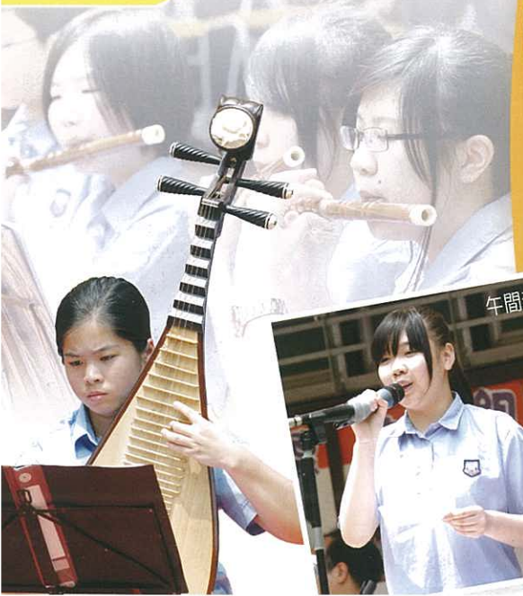
午間音樂會司儀介紹節目