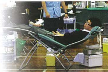
捐血過程安全，轉眼完成。