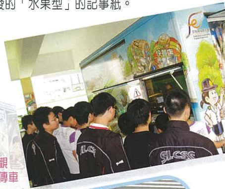
學生參觀 流動宣傳車