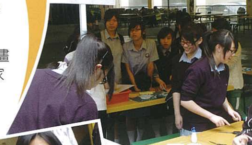
「靚爆鏡」攤位活動，反應熱烈