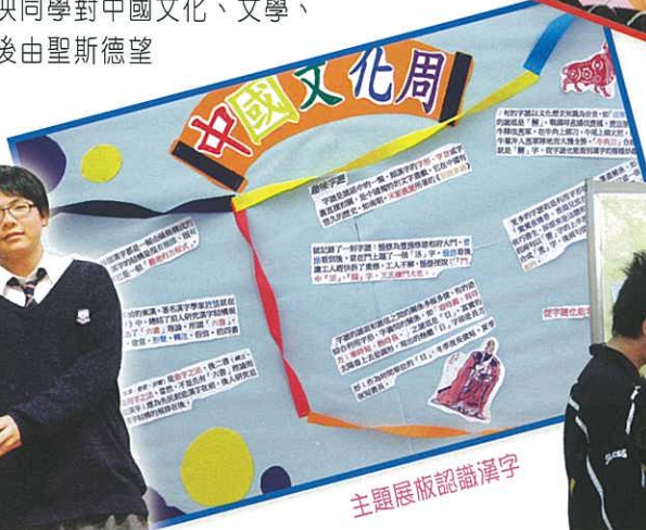
主題展板認識漢字