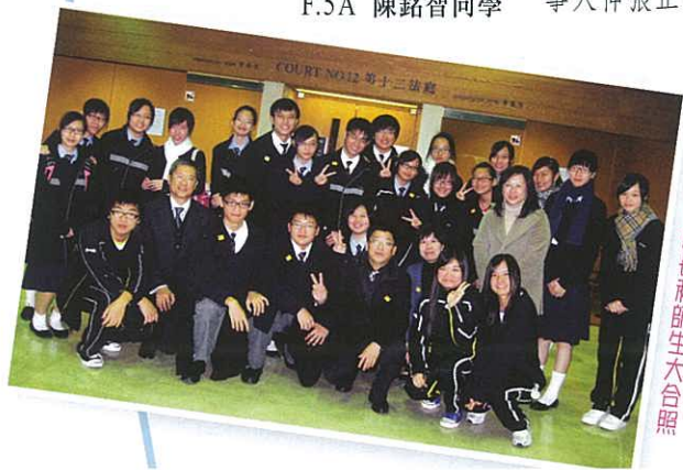
羅校長、陳校長和師生大合照