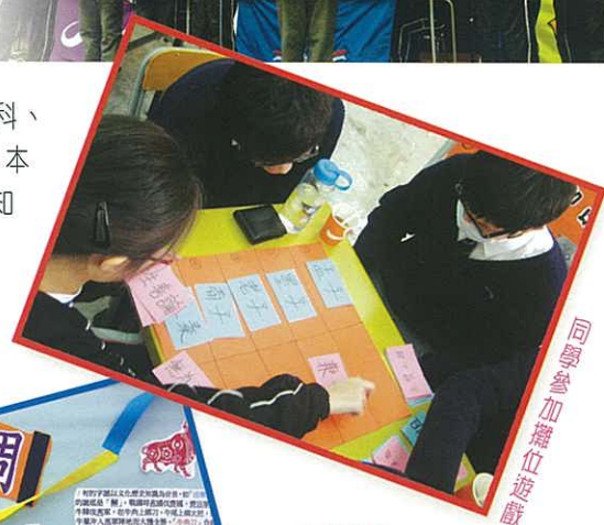
同學參加攤位遊戲