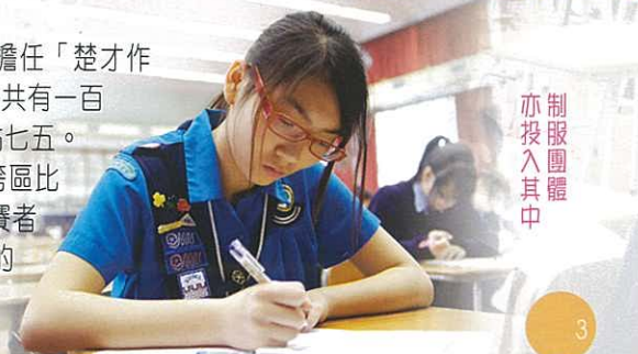
制服團體亦投入其中