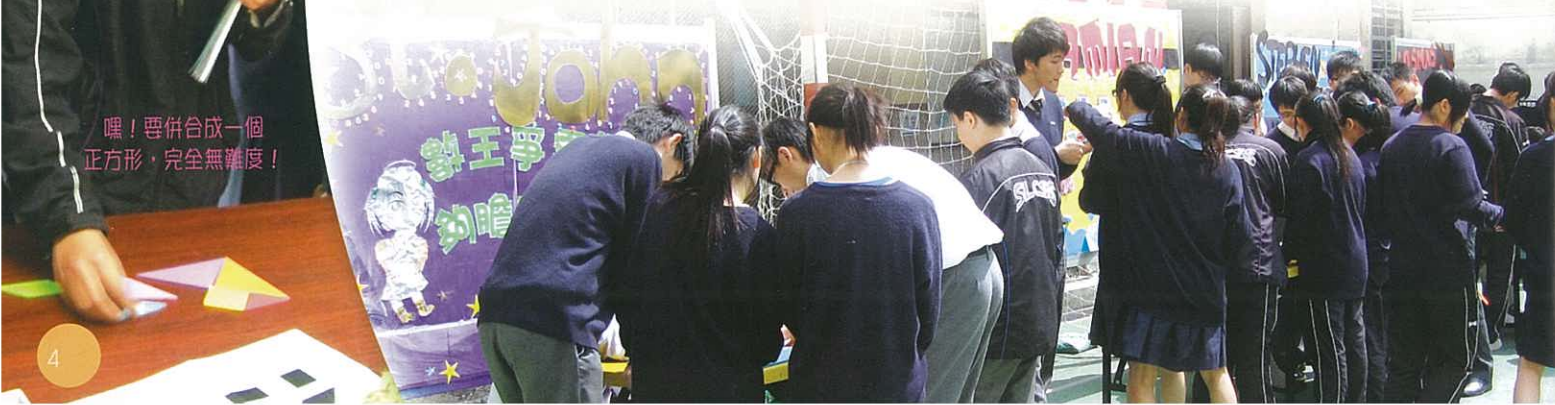
嘿！要併合成一個正方形，完全無難度！