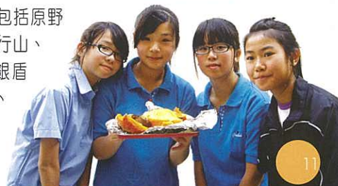
制服團隊 聯歡活動

本學年女童軍活動多姿多采，包括原野烹飪、繩結製作、步操訓練、露營、行山、手工藝製作、賣獎券、參加交流團和銀盾比賽等，發展多種技能，從中建立自信、訓練領袖才能和團隊精神。