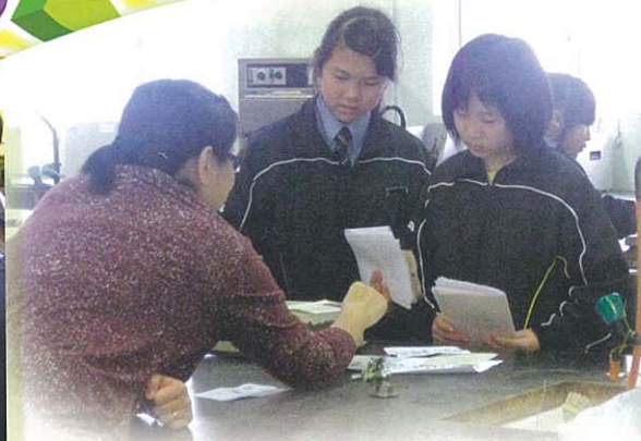
老師正用心地講解實驗時要注意的事項