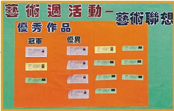
「藝術畫作聯想創作比賽」得獎作品