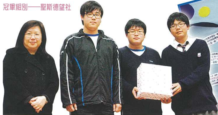
冠軍組別——聖斯德望社