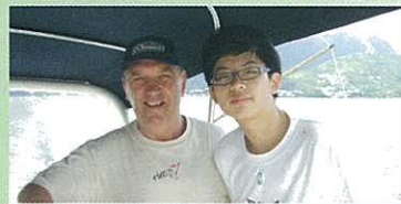
An English Boat Trip in Sai Kung