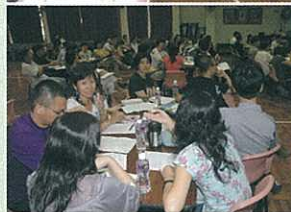
Teacher phonics program