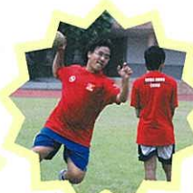
石籬天主教中學學生 代表香港遠赴台灣 參加手球比賽