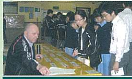
'I can say it' counter