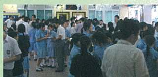
'Shall we talk' counter