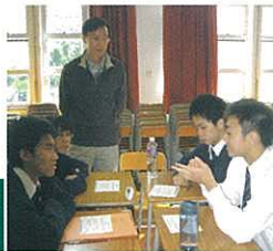
Lunch time oral practice