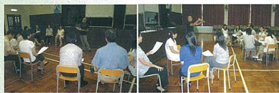
Teacher Drama Workshop