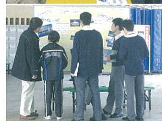
Non-English Subjects English Speaking Activity