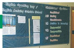
English Speaking Zone outside the English Staff Room