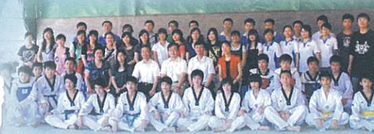
中六同學與老師探訪深圳西鄉中學

為配合2009年開始的新高中學制，本校致力設計和落實新學制的各項課程安排，讓學生在課堂內外均能有更多元和更適切的學習經歷；此外，本校強調優化教學策略，發展學生主動探索學習、以提問啟發思考、鍛鍊同學溝通和表達技巧、以及善用資訊科技等，以迎合新課程的要求。本年度本校舉行多項的教師專業發展活動，如課堂研究計劃、友校交流、同儕互相觀摩分享等，以進一步提升教學效能。