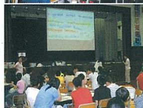
F.1 Summer English Bridging Activities