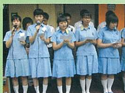
English Day Morning Assembly held by students