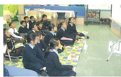
Big Book Story Time