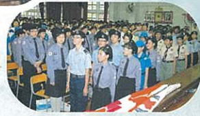
制服團體宣誓典禮