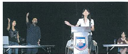
An English Debate Demonstration